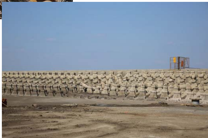
照片3 桃園藻礁海岸的消波塊工程。無形中，海岸失去了其自然海岸的特色。