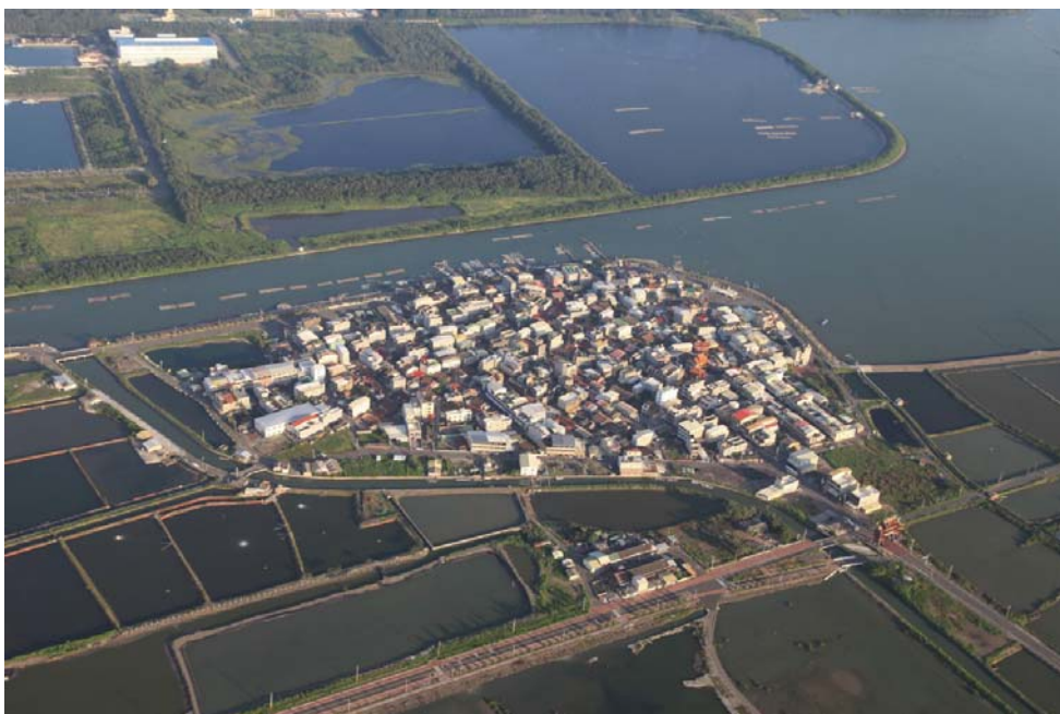
照片6 台灣西南海岸的漁村，從空中鳥瞰，如果受到極端氣候或颱風影響，都顯得非常脆弱。

以符合生態與保育標準之工程方式進行海岸相關維護及建設，同時有助於海岸風景區的美觀。重建海岸生態景觀為重要標的。因為海岸生態工程的精神是以保育的方式出發，對海岸生態的破壞相對較小，因此有許多的海岸地帶得以保存原有的風貌。對於海岸變遷而言，海岸以生態工程手法處理相關建設，避免阻絕人與自然的隔閡，是海岸經營管理應該納入思考的，尤其是屬於海岸濕地或具有特殊地景的區域，尤應避免破壞景觀的工程手法處理。