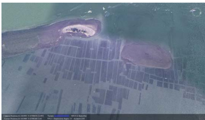
照片5 台灣西南沿海的養殖漁業，具有非常高的經濟價值，必須小心面對氣候變遷。