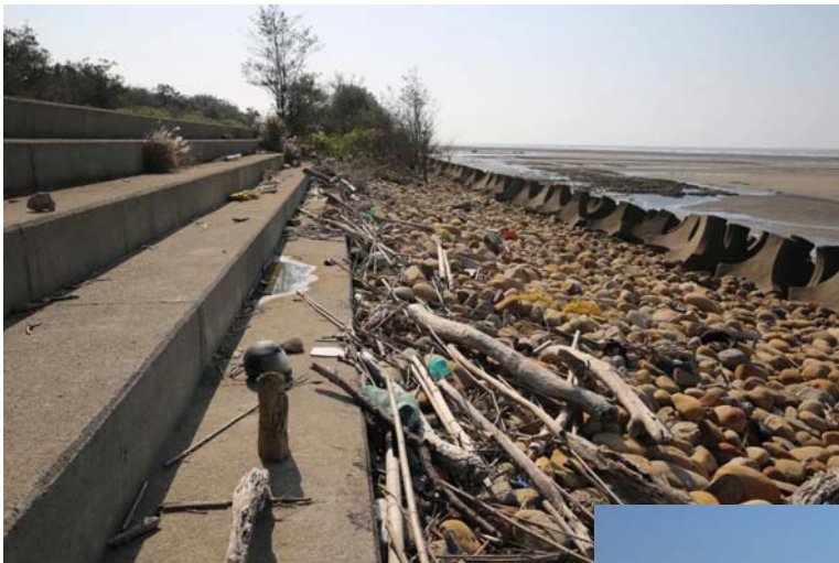
照片2 桃園藻礁海岸的工程，以海堤與消波塊阻隔了人與大自然。

有些海水面變遷，甚至是因為人為的因素造成的。許多人類的活動也因此而受到限制乃至於極大的損失。台灣西南沿海的地盤下陷問題，便是一例。由於超抽地下水，造成區域性的沈陷與增加洪水所帶來的災害。人為造成的海水面相對上升，對土地利用的影響是深遠的。同時也不易尋求對策，因為所需要的經費，以及所可能造成的影響都是