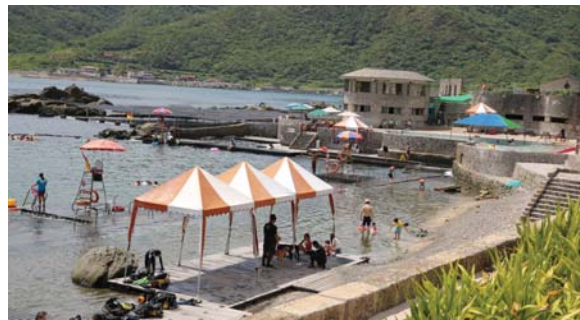
照片1 台灣東北角海岸有許多的海蝕平台過去被挖為九孔養殖池，目前則成游泳池，未來在颱風作用下，如何減災，將是另一挑戰。