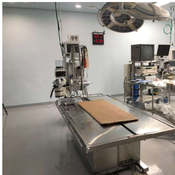
照片2 黑熊復育中心的手術房