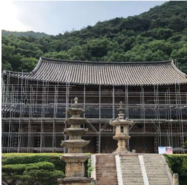
照片1. 智異山國家公園的華嚴寺的修復工程