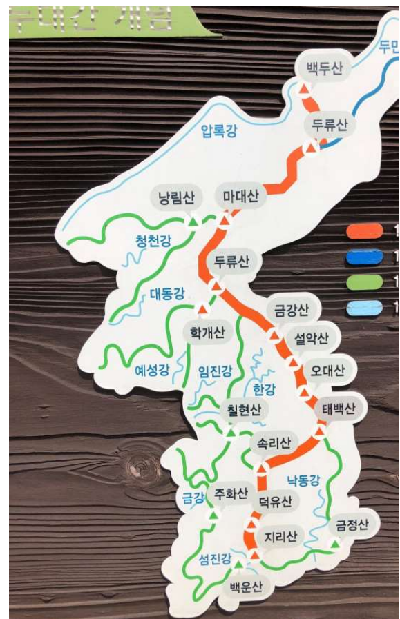
照片4 韓國半島的山脈與保護區（紅色線段），串連了南北韓的保護區系統