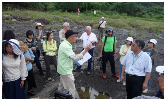
圖13 三貂角火成岩脈解說