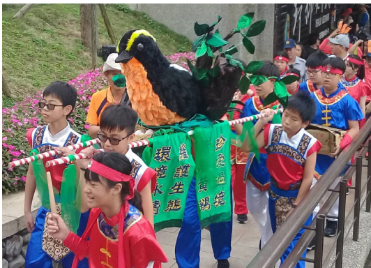
攤位時遊客接觸/互動

在接近約莫13:00時，便開始陸續有附近不同國小的抬轎遊行於野柳地質公園的步道上，並透過此遊行活動傳遞小朋友各自想傳達的理念以及想法，整個野柳地質公園的氛圍在小朋友活潑青春地渲染下也變年輕了！那在小朋友遊行的路途中，也會有市集攤位的人發糖果給小朋友們，以作鼓勵性質。相信這樣的遊行互動的活動，對於小朋友、當天的訪客等而言，必定會是很難忘的經驗。