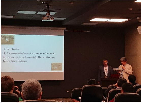
圖7 地質公園場次論文發表