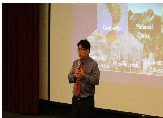
圖4 內政部營建署吳署長欣修致詞