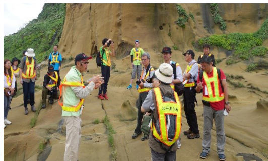
圖12 和平島野外考察