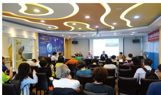
圖11 野柳地質公園論壇