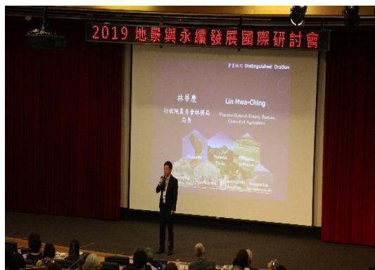
圖5 行政院農業委員會林務局林局長華慶致詞