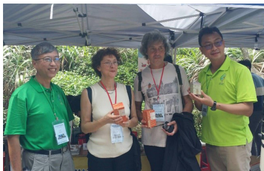
圖9 外賓參觀馬祖地質公園攤位

4. 整體而言，除了謝謝各單位的協助外，也要謝謝所有參與的伙伴，不管大家是論文發表，還是幫忙整個會務的進行。沒有大家的幫忙，是無法成事的。