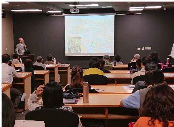
圖8 里山里海場次論文發表