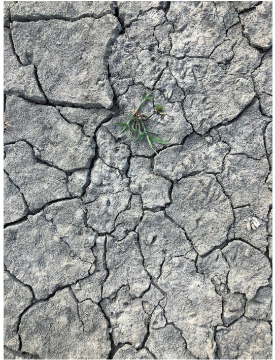
照片6.4. 雪泥鴻爪，生物痕跡其中