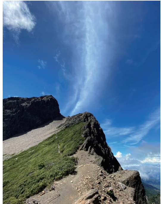
照片2. 雲的不同神情、破碎的地質露頭、與玉山圓柏，顯示著風的方向在人穿越的步道中，構成地景閱讀 (王文誠, 2020.7.4.)

民族誌是一種寫作文本(text)，透過田野閱讀，提供對人類社會書寫。其方法建立在一個概念上(argument)，提供一個可衡量的基礎，是一種文化人類學方法論本質。人類學是一門研究過去與當代人類社會學科，