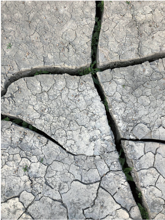
照片6.3. 三角龍皮膚上鱗片