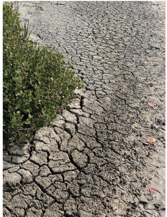
照片5. 泥裂 (2021.7.4.)

讀景本文建議有三種模式，第一、從自然、人文及心情的角度，「鹿野忠雄模式」是再現地景；第二、時空交會的片刻，「張愛玲的遇見」則是瞬間景觀；第三、「印象派的畫作」模式，則是反應心靈地圖。這三種模式，閱讀及書寫自然地景、人文地景、及再現地景。