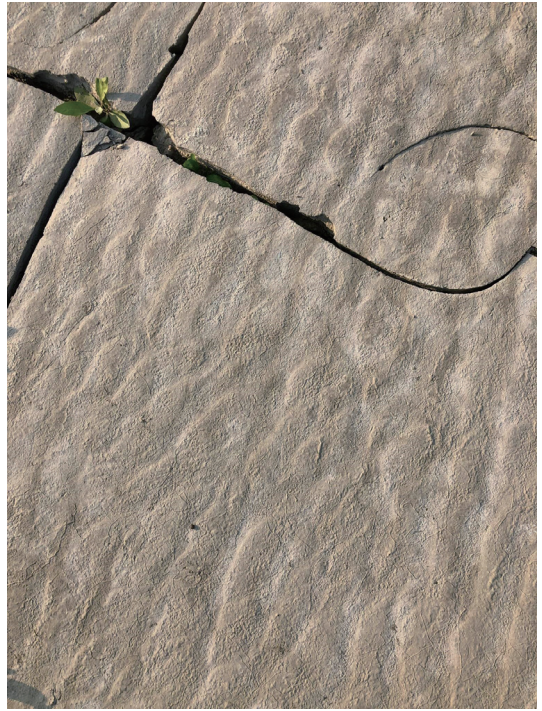
照片6.2. 水波、泥裂中美洲苞菊