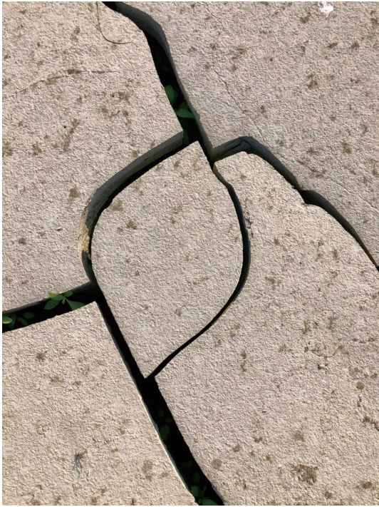
照片6.1. 米羅超現實主義的再現