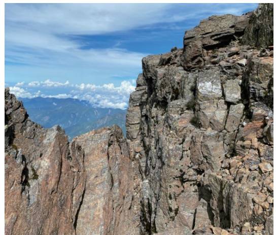
照片1. 褶皺、風化、侵蝕，構成了玉山脆弱易崩落的地質條件（王文誠，2020.7.3.）

所以上述引用的文中，「混雜著石英的砂岩露出，稜脊向東傾斜」、「山腰以下是森林，以臺灣鐵杉、五葉松和冷杉主」是受過科學訓練才能閱讀地質、地形、植物及生態地景。